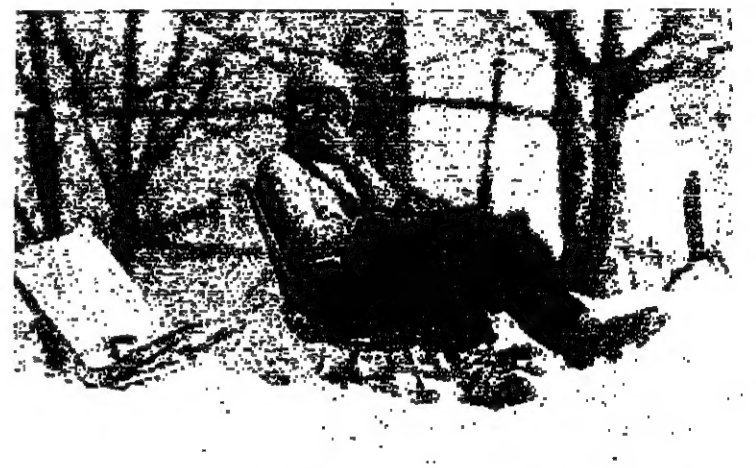
جلسة تحت الشمس وسوق الثلج